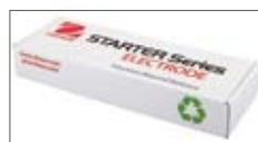
多种ST系列电极可选